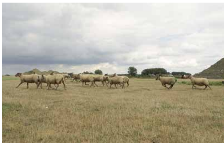
Schapen begrazen de afgedekte stortputten